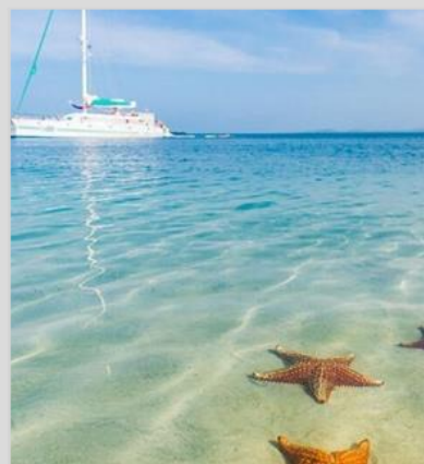
Bocas del Toro

Før påske reiser hele skolen på en innholdsrik og spennende tur til Nepal!